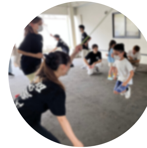
ダブルダッチ体験会