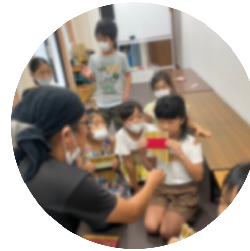
パンフルート作り&演奏会