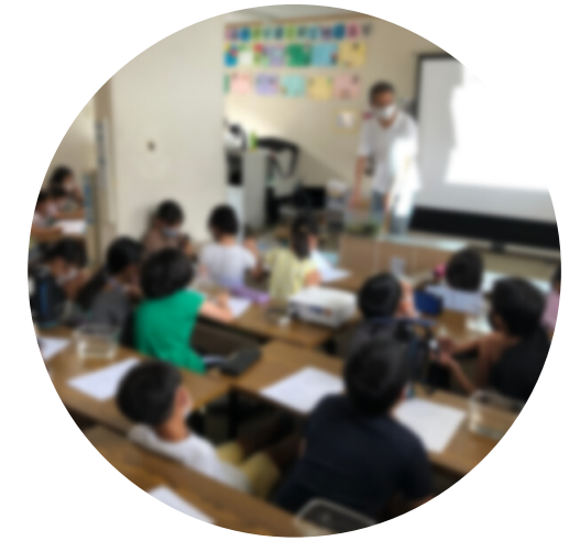
メダカの観察・飼い方

体験活動+Plus（プラス）では、「放課後にわくわくとまなびをプラス」をコンセプトに、大学のサークルや地域の方々、企業とコラボレーションをした体験活動を行っています。職員が企画した活動も含めて月1回～2回開催しています。参加は申込制と全員を対象とした活動どちらも行っています。